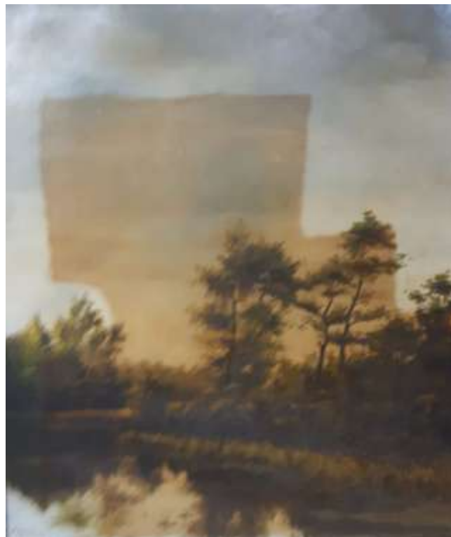
tijdens de restauratie

blad). Dat houdt in dat hij dit werk heeft gemaakt toen hij net 17 jaar oud was! In het jaar daarop begon Sierd met z'n studie aan de Academie Minerva te Groningen. Dit schilderij kan dus geen studieopdracht geweest zijn, zoals eerst verondersteld werd. De restauratie/schoonmaak is zeer goed geslaagd en daarmee is dit bijzondere schilderij weer in volle glorie te bewonderen.