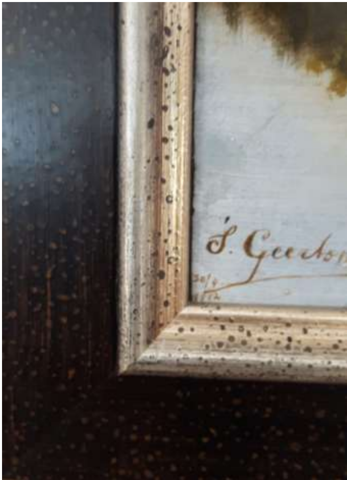
De handtekening van Sierd als 17-jarige met datum 30/4 1912