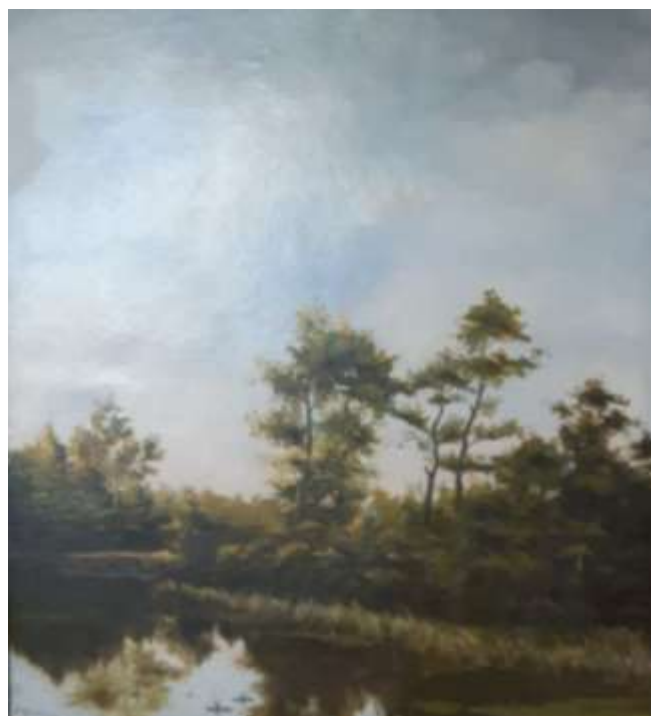
na de restauratie